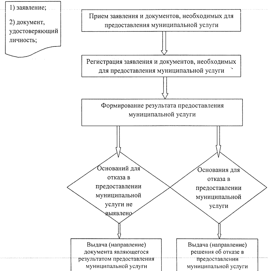
Блок-схема по предоставлению муниципальной услуги по выдаче выписок из Реестра муниципального имущества